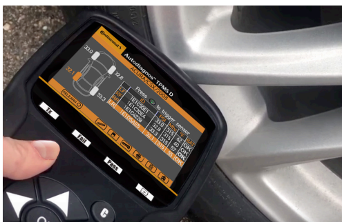
Herramienta Autodiagnos™ TPMS SE