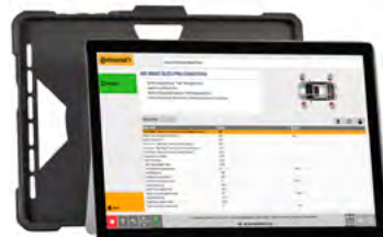
Potente tableta Microsoft Surface Go de 8 GB con estuche protector. El juego de lujo incluye: Tableta precargada con el software Autodiagnos™ Pro. P/N: 2910002401800