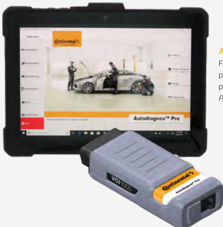
Autodiagnos™ Pro Funciones únicas para una productividad incomparable para los técnicos P/N: 2910002330700

Más que una herramienta de diagnóstico, Autodiagnos™ Pro es un recurso que se actualiza a medida que los vehículos evolucionan. Autodiagnos™ Pro fue diseñado por ingenieros que desarrollan herramientas para hacer pruebas en las líneas de producción y sistemas de diagnóstico para fabricantes de equipo original. El diseño, la construcción del hardware principal y el soporte técnico de la herramienta se llevan a cabo en los Estados Unidos.